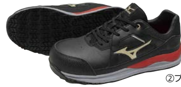
②ブラック×ゴールド