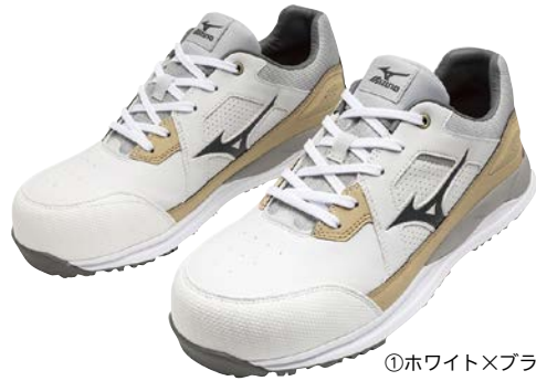
①ホワイト×ブラック